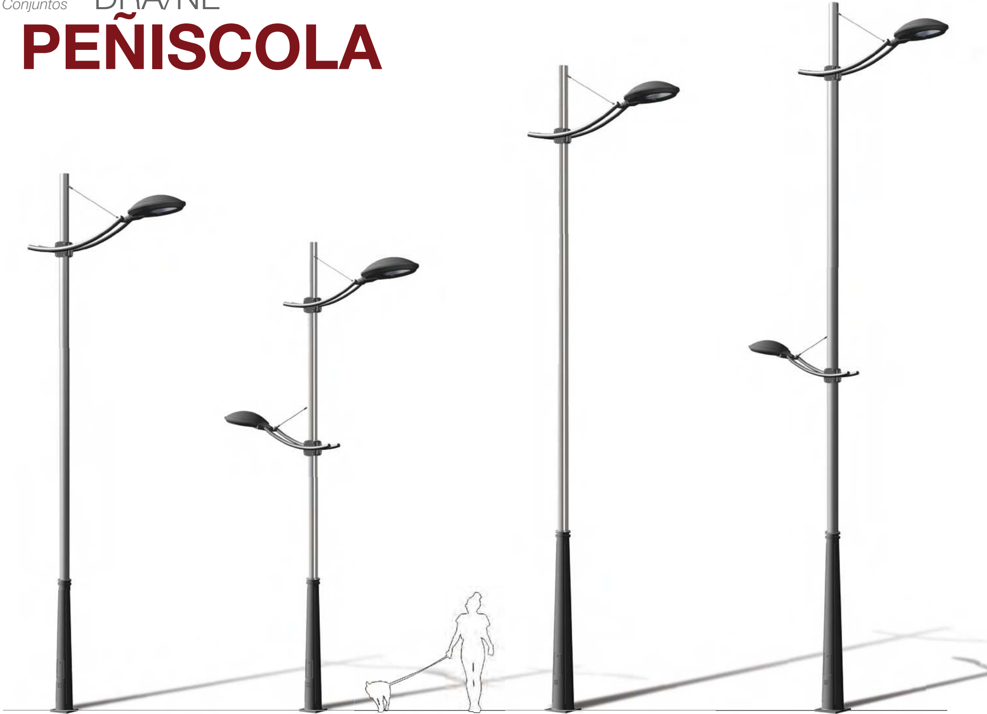
PEÑISCOLA DRA-5804 P