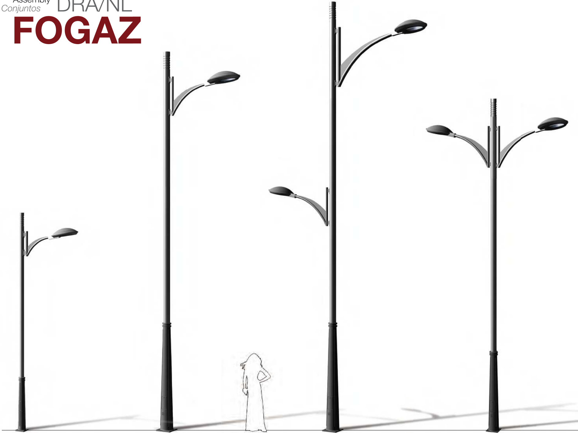
FOGAZ DRA-5006 P