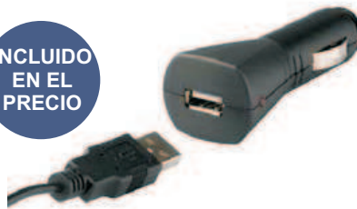
CONECTOR CARGADOR MECHERO USB