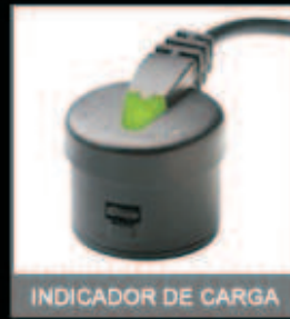
INDICADOR DE CARGA