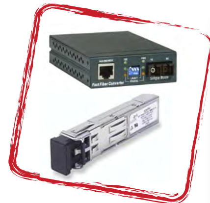
Electrónica de red.