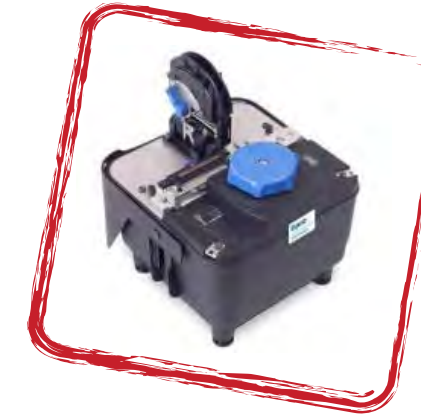
Record Splice. Conexión rápida de pigtails.