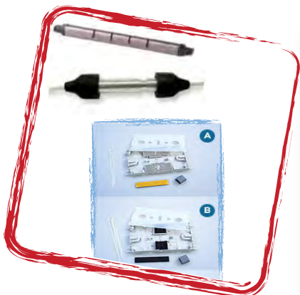
Empalmes y bandejas porta empalmes.