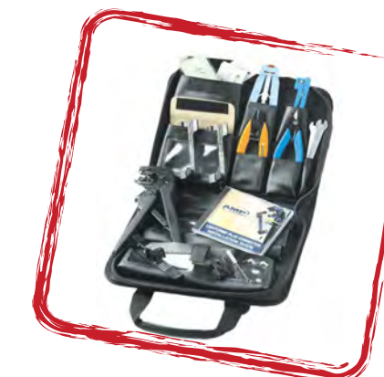
Kit de herramientas lightcrimp.

Conexión de conectores y empalmes de pigtails.