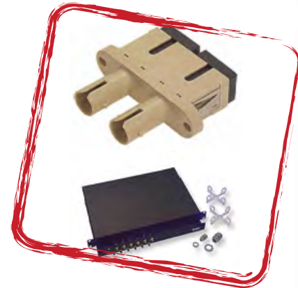
Bandejas para instalación en rack.