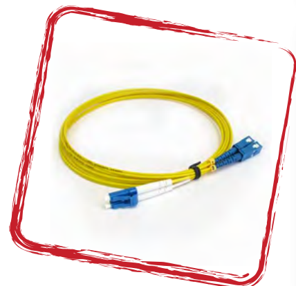
Latiguillos de fibra óptica en monomodo y multimodo.