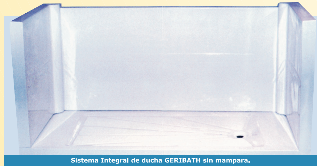
Sistema Integral de ducha GERIBATH sin mampara.

Eficaz: Geribath minimiza todos los inconvenientes, ya que todas las adaptaciones que se han realizado en Residencias, se han efectuado sin interrumpir la actividad del centro y funcionando al 100% de su capacidad, siendo utilizada una misma habitación doble por una persona válida y otra asistida, terminando así con los traslados (que en algunas ocasiones se consideran una discriminación).