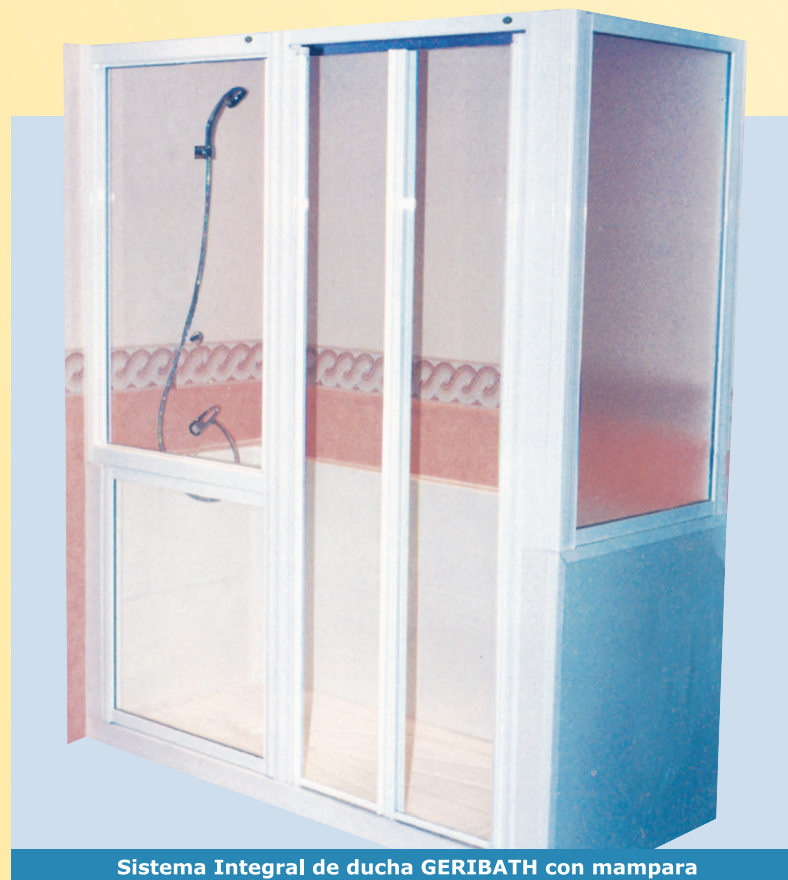
Sistema Integral de ducha GERIBATH con mampara