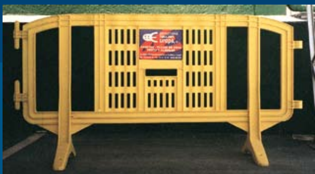
VALLA PEATONAL ECOLÓGICA