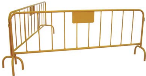
VALLAS de 2 PIES DE HORQUILLA

(Chapa de 66x30 cm. Altura de 1 m. De 2 Pies o de 1 Pie.)