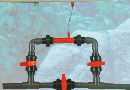
SISTEMA VENTURI VENTURI SYSTEM

Water ozonising treatment system which, with its strong germ-killing power, guarantees high quality water for consumption.