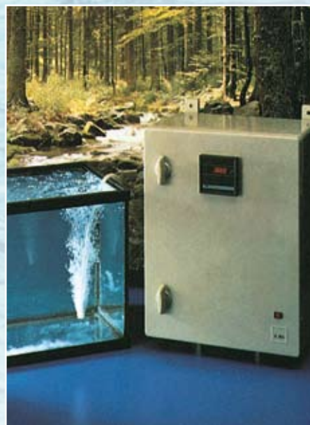
INYECCIÓN POR COMPRESOR INJECTION FOR COMPRESSION

MINIMUM CAPACITY 1.200 L/h and 3.000 L/h MAXIMUM