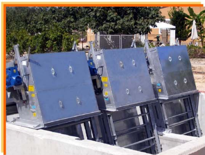
LIMPIARREJAS DE CADENAS