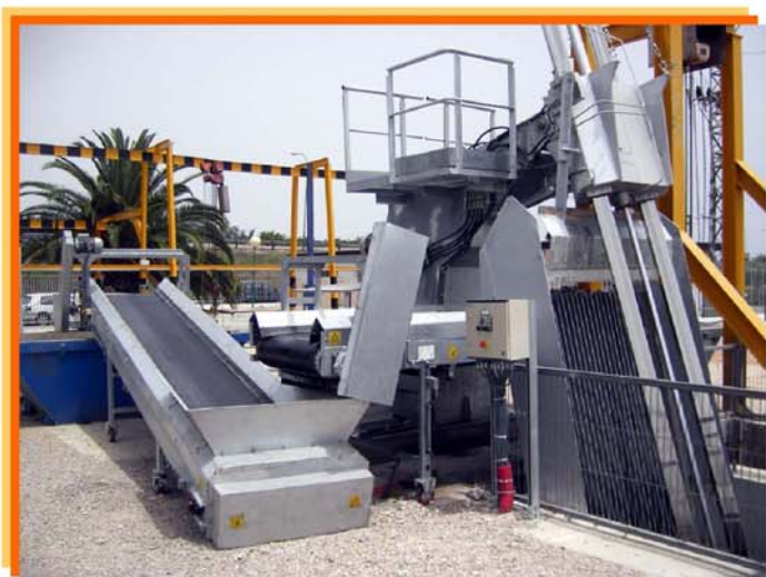
LIMPIARREJAS HIDRÁULICO Y CINTA TRANSPORTADORA