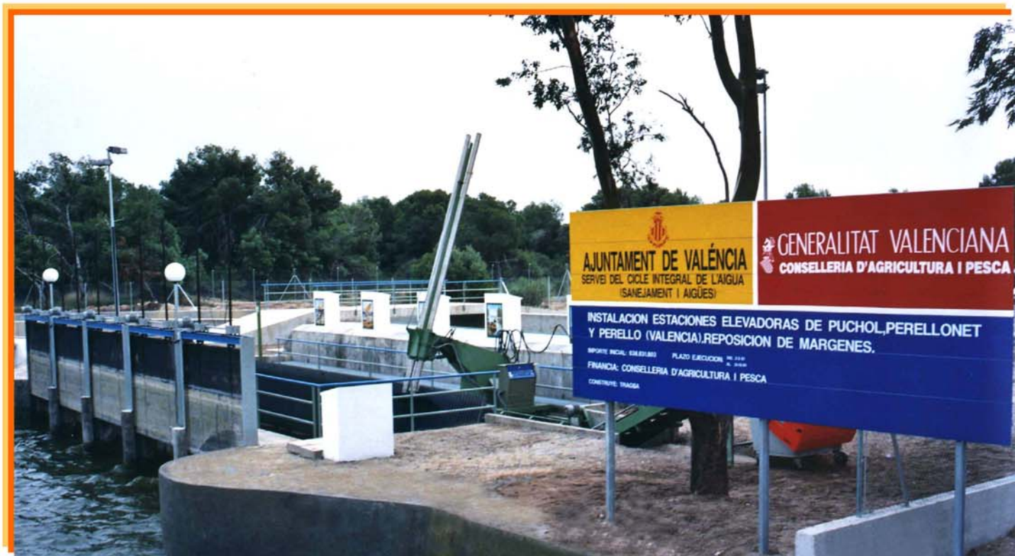
COMPUERTAS MOTORIZADAS Y LIMPIARREJAS HIDRAULICO