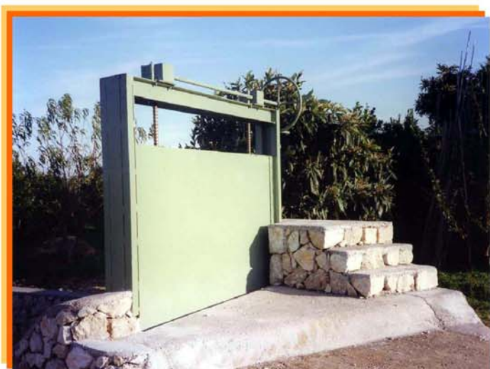
COMPUERTA MANUAL CON DOBLE CAJA REDUCTORA