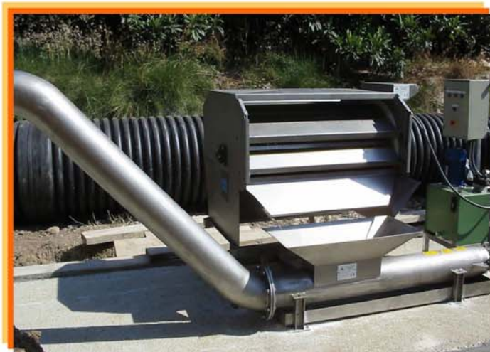
TAMIZ ROTATORIO Y PRESA DE RESIDUOS