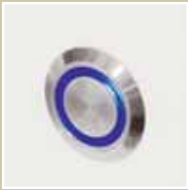
Pulsador electrónico Electronic pushbutton