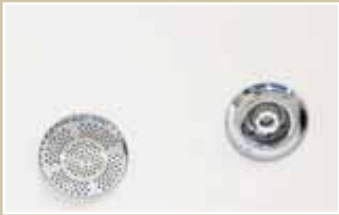
Hidromasaje agua Hydromassage water