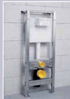
COMPAC INODORO COMPAC TOILET COMPAC W.C.

Mecanismo para inodoro de accionamiento frontal, para instalaciones individuales o en serie. Equipado con elemento bastidor para inodoro, accesorios de instalación, dos pernos para fijación de la taza al soporte, cisterna de doble descarga (6 l / 3 l), pulsador doble en blanco o en cromo y una guía opcional de fijación a la pared.