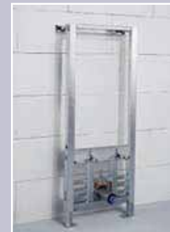
COMPAC BIDÉ COMPAC BIDET COMPAC BIDET

Toilet flushing mechanism with frontal push button for individual or serial installation. Provided with support frame, installation accessories, 2 fixing bolts for mounting the bowl to the frame, dual discharge cistern (6 litre/ 3 litre), and dual push button in white or chrome. An optional guide for the wall fixing is available.