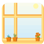
Fabricación de puertas y ventanas.