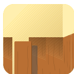
Paneles de madera.