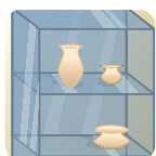
Vidrio y plásticos varios.