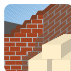
Materiales de construcción Hormigón, mármol, piedra, cemento, yeso.