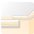
Molduras de escayola.