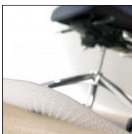
Alfombrilla con lengüeta para moqueta Square chairmats (carpets)