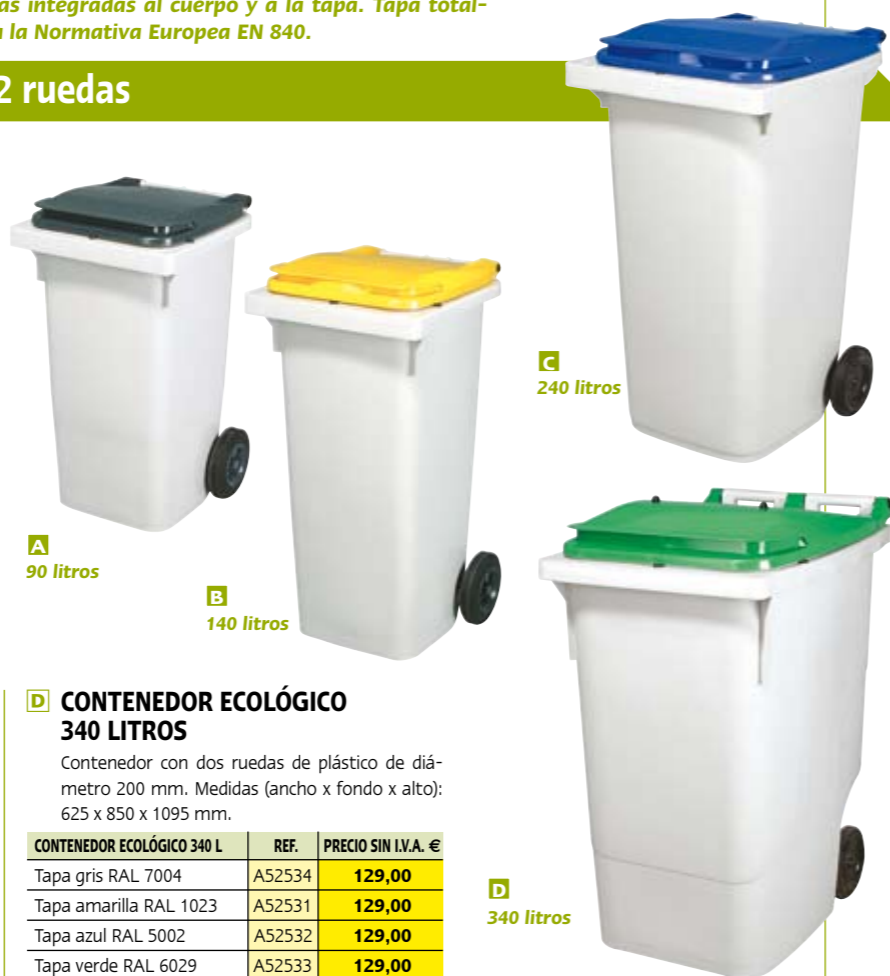
A 90 litros