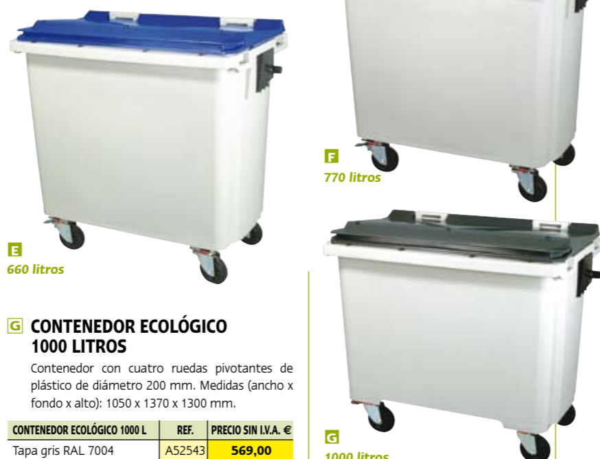
E 660 litros