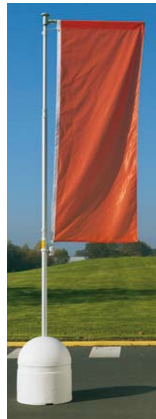
Base jumbo I y mástil telescópico con potencia giratoria.