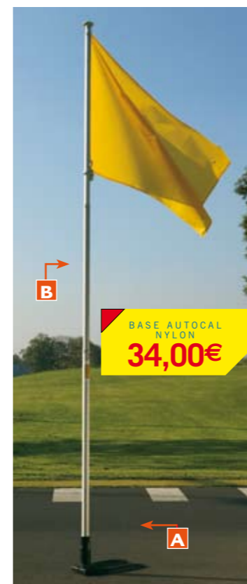
Base Autocal y mástil telescópico simple.