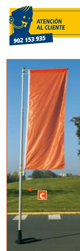
Base Autocal y mástil telescópico con potencia giratoria.