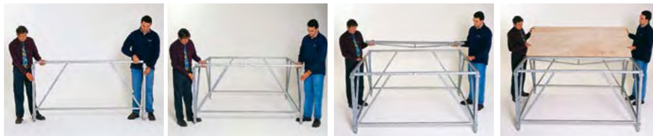
1 - Encaje del marco sobre los postes de rosca.

El suelo está realizado en madera contrachapada de 25 mm de grueso, en cuadros de 2 x 1 m. Asegura una perfecta escuadría y está diseñado para soportar una carga de 500 kg/m 2 .