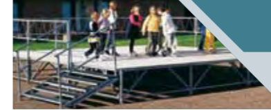
4 - Colocación de las planchas.