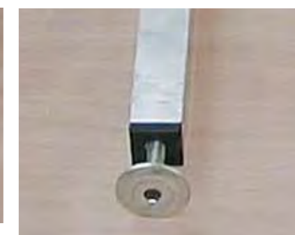
Juego de 4 pies telescópicos