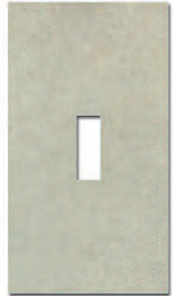
Ventana Decor Manhattan Ópalo 33x60 MT270