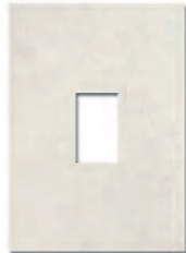
Ventana Decor Manhattan Blanco 23,5x33 MT070