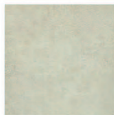
Manhattan Ópalo 33,3x33,3 MT380