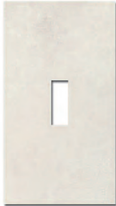
Ventana Decor Manhattan Blanco 33x60 MT270