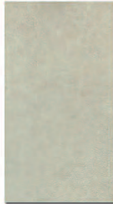
Manhattan Ópalo 33x60 MT420