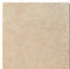
Manhattan Ocre 33,3x33,3 MT380