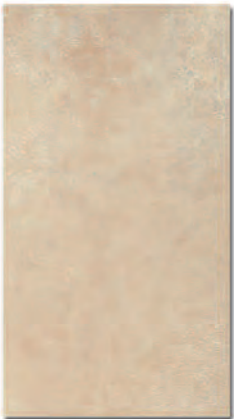
Manhattan Ocre 33x60 MT420