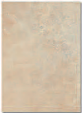
Manhattan Ocre 23,5x33 MT380