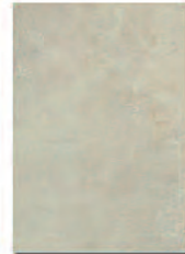
Manhattan Ópalo 23,5x33 MT380