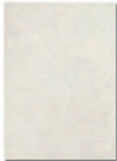
Manhattan Blanco 23,5x33 MT380