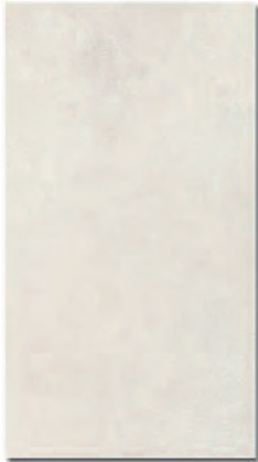
Manhattan Blanco 33x60 MT420