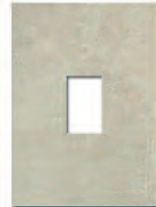
Ventana Decor Manhattan Ópalo 23,5x33 MT070