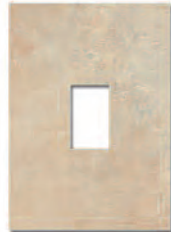
Ventana Decor Manhattan Ocre 23,5x33 MT070