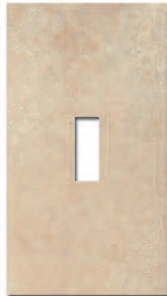
Ventana Decor Manhattan Ocre 33x60 MT270