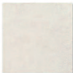
Manhattan Blanco 33,3x33,3 MT380