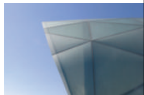
SatenGlas® 8 y 10 mm Hangar 7-8. Salzburg Airport (Austria)