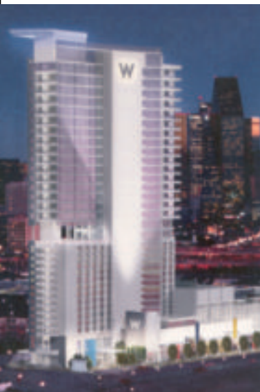
SatenGlass® Victory W Dallas (USA) (En construcción)